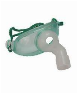
Máscara de Traqueostomía