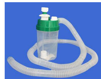
Nebulizador de alto flujo