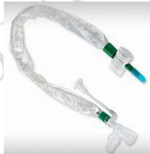
Trachcare succión cerrada